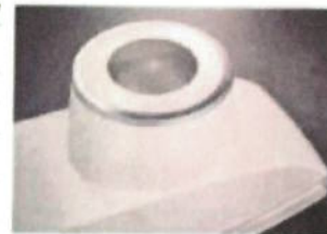
Ulepszona konstrukcja osłon ramienia FlexArm